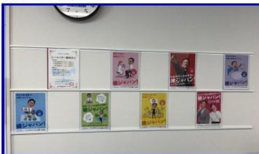
熊本本社事務所入口及び通路

弊社の目標とする推進事項等に関し、従業員だけでなく、 一般の方への普及・啓発効果 を考え、 事務所周辺で見やすい場所への掲示 に取組み、 ご来場されるお客様に対しての見える化を推進 熊本本社事務所内